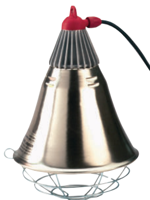
849740. Lámpara INTERHEAT. Cable de 5 mts.

Cuerpo principal muy resistente al calor, campana con gran proyección. Rejilla, cable con enchufe y colgador con cadena. Se entrega desmontado y se acopla con una sencilla operación.