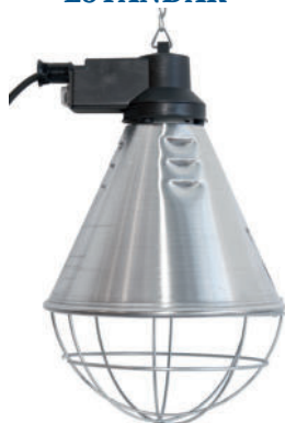
849750. Proyector estándar con economizador. Rejilla de Protección. Colgador con cadena y cable de 5 mts. con enchufe.