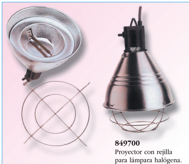
849700 Proyector con rejilla para lámpara halógena.