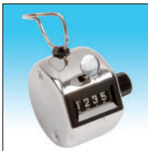
850100. Contador manual de ganado.