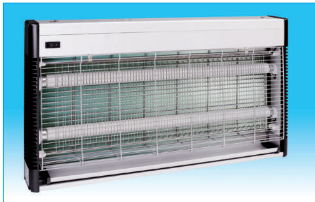
850014. Insecticida eléctrico de 40 W. con 2 lámparas de 20 W. Tamaño : Ancho : 65 cm. Alto : 36 cm. Fondo : 8 cm.