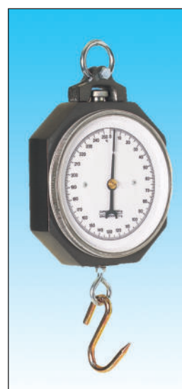
850430. 250 kg. (en 1000 grs.)