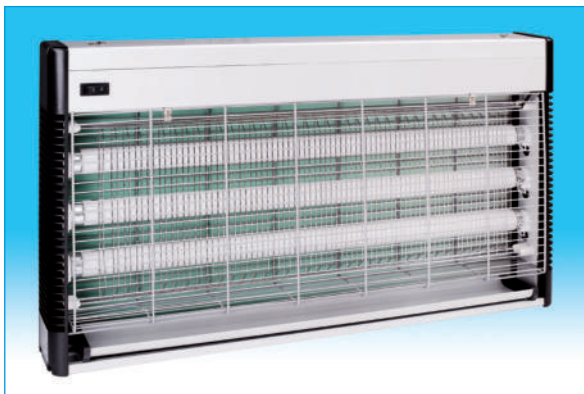
850012. Insecticida eléctrico de 60 W. con 3 lámparas de 20 W. Tamaño : Ancho : 65 cm. Alto : 36 cm. Fondo : 8 cm.