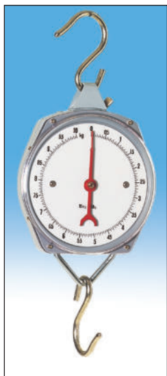
850400. 10 kg. Graduación en 50 grs.