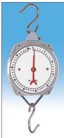
850420. 50 kg. Graduación en 200 grs.