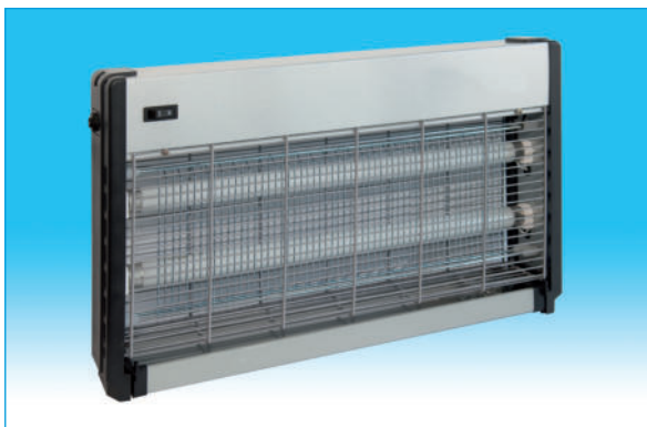
850015. Insecticida eléctrico de 30 W. con 2 lámparas de 15 W. Tamaño : Ancho : 50 cm. Alto : 32 cm. Fondo : 10 cm.