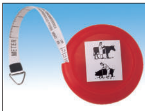
850200. Cinta ENROLLABLE. Vacuno y porcino.