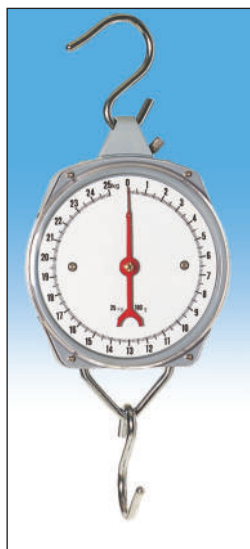
850415. 25 kg. Graduación en 100 grs.