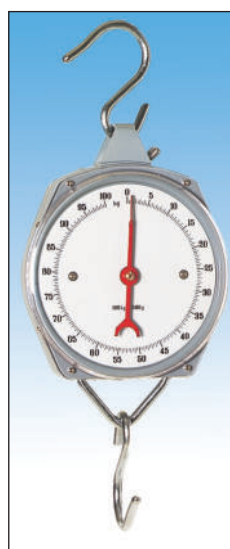
850425. 100 kg. Graduación en 500 grs.