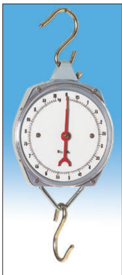
850400. 10 kg. Graduación en 50 grs.