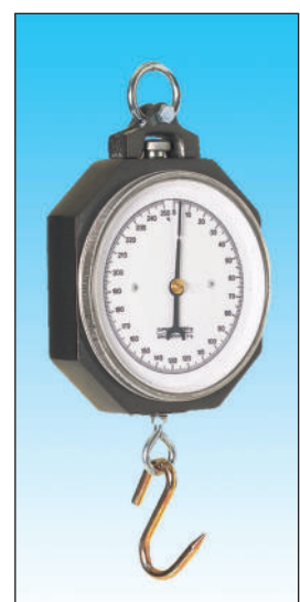
850430. 250 kg. (en 1000 grs.)