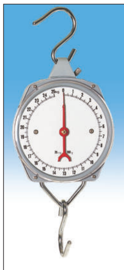
850415. 25 kg. Graduación en 100 grs.