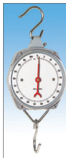
850425. 100 kg. Graduación en 500 grs.