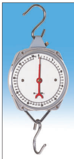
850420. 50 kg. Graduación en 200 grs.