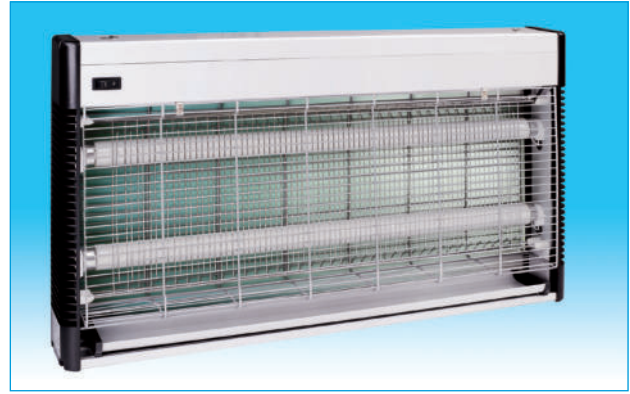
850014. Insecticida eléctrico de 40 W. con 2 lámparas de 20 W. Tamaño : Ancho : 65 cm. Alto : 36 cm. Fondo : 8 cm.