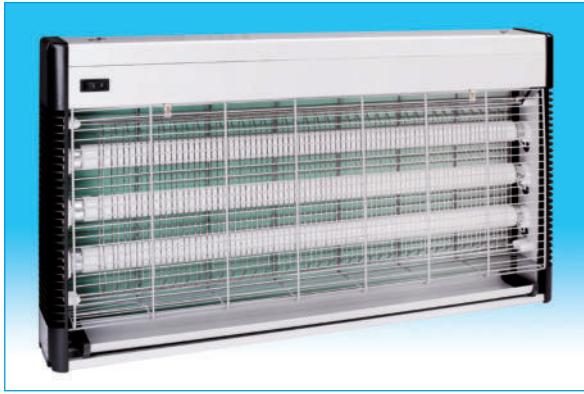
850012. Insecticida eléctrico de 60 W. con 3 lámparas de 20 W. Tamaño : Ancho : 65 cm. Alto : 36 cm. Fondo : 8 cm.